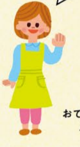
おでかけひろば スタッフ

親子で気軽に立ち寄ることができ、他の親子やスタッフと交流したり、経験豊富なスタッフに気軽に育児相談もできます。区内に30ヶ所以上あり、原則無料で利用できます。