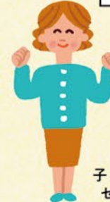
子ども家庭支援 センター職員