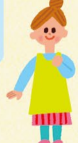
子育て応援 相談員