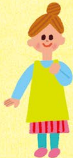
子育て応援 相談員

ひとりで悩まず相談して くださいね。子ども家庭 支援センターの窓口で 待っています。