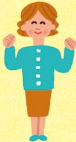
子ども家庭支援 センター職員