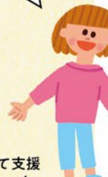
地域子育て支援 コーディネーター