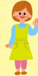
おでかけひろば スタッフ

ひろばには、同じような 仲間がいますよ。 ベビーカーで赤ちゃんと 一緒に来て。待っています。