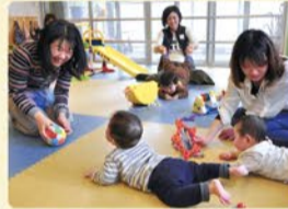
ほっとステイ スタッフ

ほっとしたい時や用事がある時に、保護者の理由に関らずにご利用いただけるお子さんの一時預かり。実施日・時間・料金は、各施設で異なるので、まずはお近くのほっとステイにお問い合わせを。